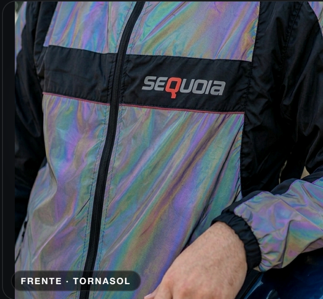
FRENTE · TORNASOL