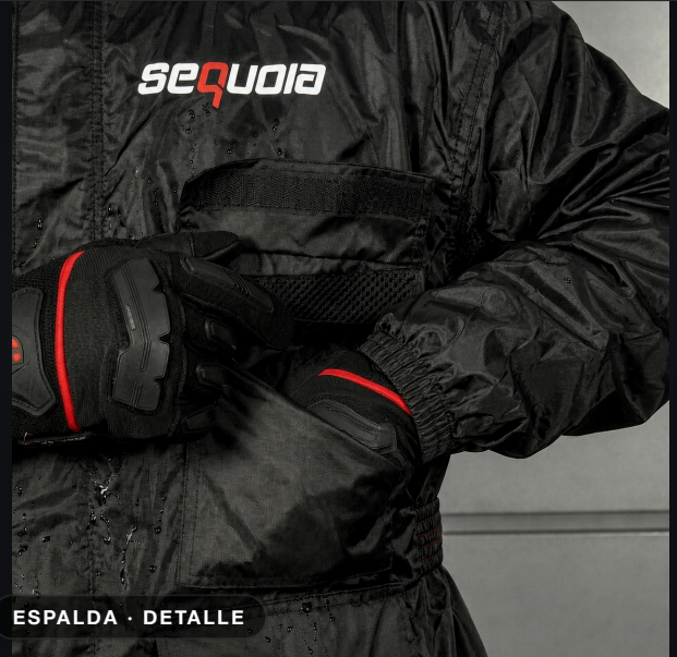
ESPALDA · DETALLE